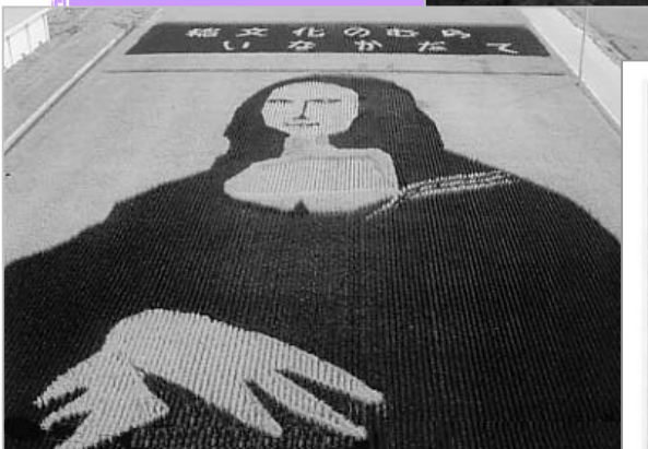
天守閣(田舎館村役場)からの眺め