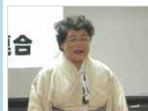
40 神 翠宣