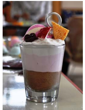
フェイクスイーツ(一例)