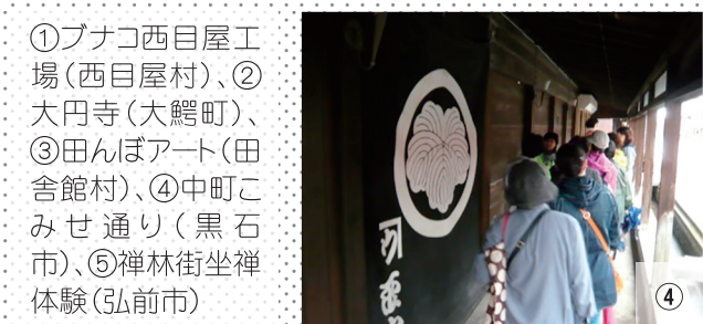
①ブナコ西目屋工場(西目屋村)、②大円寺(大鰐町)、③田んぼアート(田舎館村)、④中町こみせ通り(黒石市)、⑤禅林街坐禅体験(弘前市)