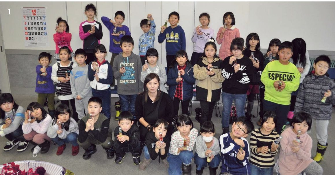
かわいい 作品完成！