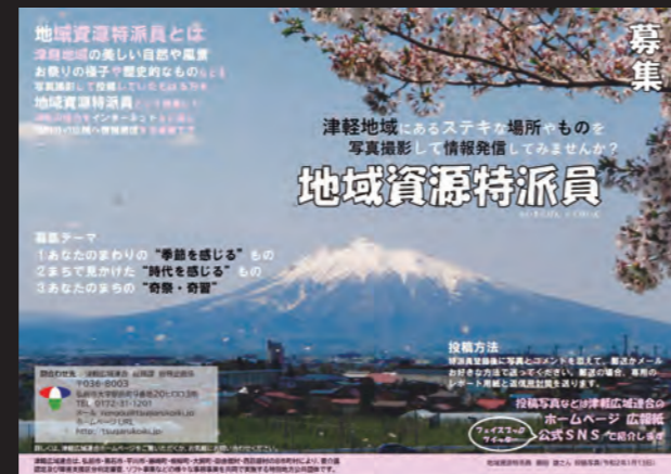
地域資源特派員募集チラシ

地域資源特派員を募集しています。 詳しくは津軽広域連合ホームページをご覧ください。