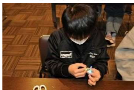
3. 発光ダイオードを光らせる