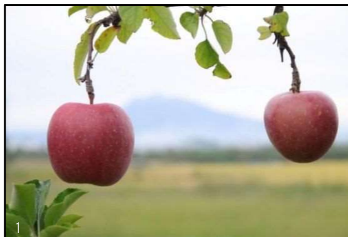
1. 「夫婦リンゴと岩木山」

地域資源特派員から投稿されたレポートの中から、津軽のちょっとした魅力を紹介します。掲載した以外にも、たくさんの素敵なレポートをホームページや公式 SNS で紹介しています。