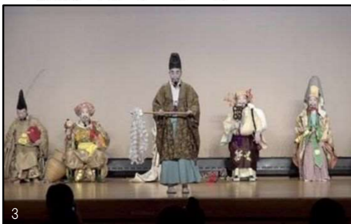
3. 「表町七福神舞」