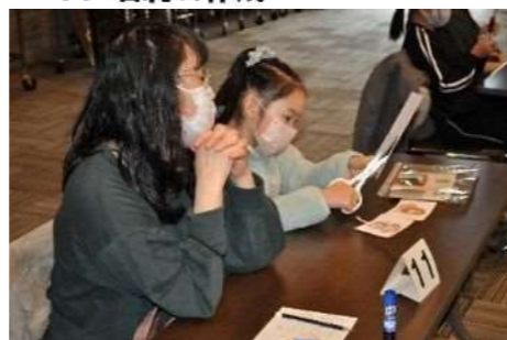
2. スリットシートの作成