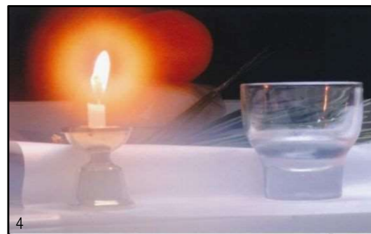
4. 「お正月」 投稿者：藤田雄さん(藤崎町)